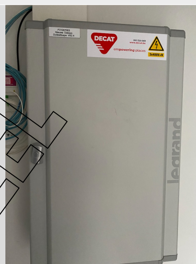
( Uitwendige foto )