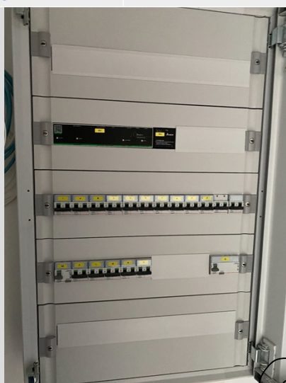
( Inwendige foto )